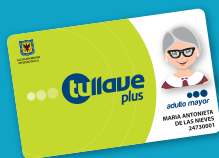
● tullave plus especial

• Inicialmente las tarjetas "tullave" plus se entregarán de manera gratuita y gradual.